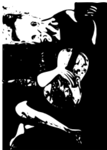
描繪圖像 / 輸出路徑 - 已簡化 (384 個節點)