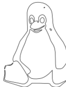
亮度臨界值 邊框，無填色