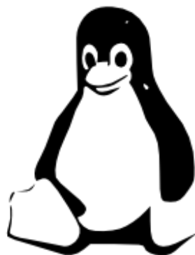
亮度臨界值 填色，無邊框