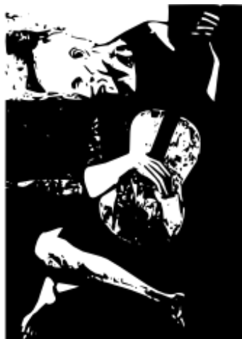
描繪圖像 / 輸出路徑 (1,551 個節點)